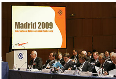
Una de las sesiones más concurridas del Congreso.

La conferencia anual de la IBA cautivó durante la semana pasada a los más de 5.000 letrados de todo el mundo con destacadas sesiones y ponentes, mucho networking y actos festivos por todo lo alto.